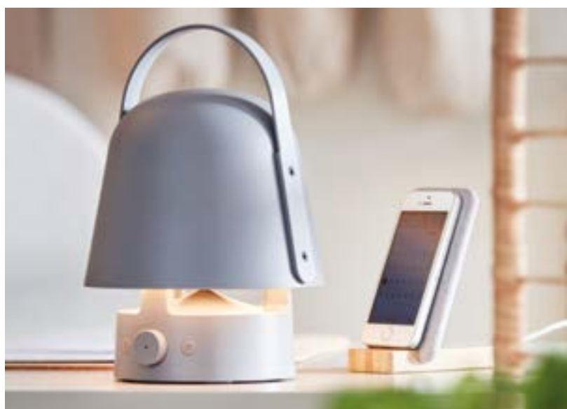
Must have 2022: les lampes nomades et connectées.