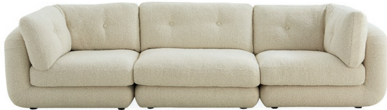
Pompidou, Modular Sectional 3 Piece. © Jonathan Adler

glamour est avant tout un élément attractif et distinctif, la pierre angulaire de toutes mes créations.