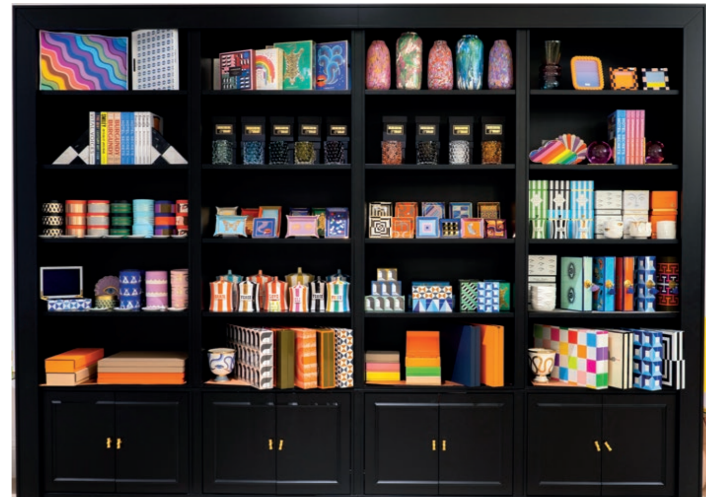
Dôme Project Interiors