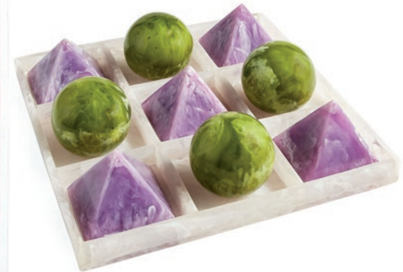
Mustique Tic Tac, Toe Set. © Jonathan Adler